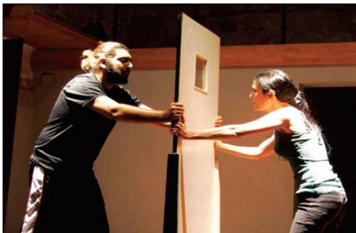
演員們演出的一個鏡頭是描述猶太人與阿拉伯人的緊張局勢與性別的議題。