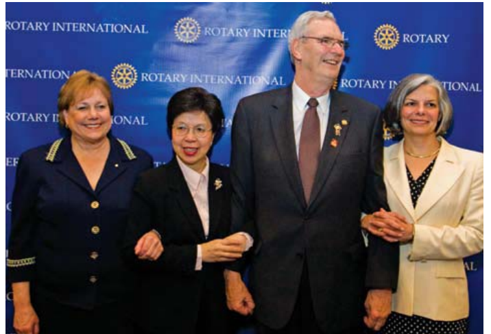
2008 年在國際扶輪洛杉磯年會上，全球根除小兒麻痺等疾病行動帶頭的夥伴組織的代表們共同宣稱終止該疾病的決心。圖中由左至右分別為：聯合國兒童基金會的執行長安·佛南曼、世界衛生組織的總長瑪格麗特·陳博士、2007-08 年度扶輪基金會保管委員會主委羅伯特·史考特博士以及美國疾病管制中心主任朱莉·葛貝爾丁。

度、奈及利亞以及巴基斯坦）也 僅有 125 個病例。 聯合國兒童基金會的執行長 安·佛南曼說：「在特別艱困的 地區內我們有效地阻止病情的 惡化，這證明了只要有足夠的決 心與支持下，我們能根絕全世界 的小兒麻痺症。」 比爾和梅琳達·蓋茨基金會全球 保健計畫的總裁雅馬達博士說： 「國際扶輪是對抗小兒麻痺症 的領航勇者，我相信全世界 的扶輪社員絕對能將此挑戰一肩 扛起。在扶輪的支持下，日後孩 童將不必生活在小兒麻痺症的 恐懼之中，全世界也可以看到， 只要同心協力，我們一定有辦法 打敗這個可怕的疾病。」 根除小兒麻痺等疾病取決於讓 五歲以下的幼童能夠接種疫苗， 這為其他疾病防治方面來說樹 立了一個有效的典範。陳博士說： 「我們的社會責任就是讓每個 孩童都能夠完成“千禧年發展 目標”。」 身為全球根除小兒麻痺等疾病 行動中最重要的非官方部門，扶 輪基金會從 1985 年至今至少提 供了七億元的款項—估計總共 五千萬美元—以及無數的心力。