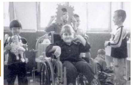
和諧相處是莫斯塔幼稚園兒童的遊戲重點

計劃協調人，同時也是第 1920 地區前總監的懷爾德(Kurt Wild)說：「對飽受破壞的莫斯塔市—甚至對整個波士尼亞—赫塞哥維納來說，這家幼稚園是建立更美好的未來一個微小但重要的一步。」這個計劃顯示基金會如何協助扶輪社與地區增進國際瞭解。每年 11 月，扶輪社必須特別針對基金會提供的服務機會，推動一項扶輪社計劃。