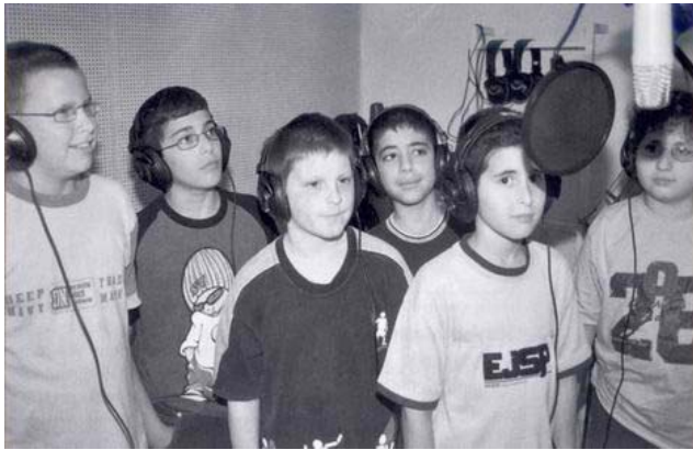
學生在一所扶輪贊助的學校的錄音課程中，等待錄音提示