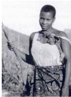
馬拉威一位婦女揹著她因愛滋病身亡的姊姊的四個遺孤之一。由於扶輪基金會的協助，馬拉威的林比(Limbe)扶輪社及許多美國的扶輪社匯集食物等資源給一項多面性；以特區為單位的計劃，協助馬拉威37個村莊裡頭3000多名孤兒及他們的家人

扶輪社紀念家庭週的另外一個方法是頒發國際扶輪的家庭與社區服務獎狀(575-EN)，來表彰個人及團體的卓越服務。請與我們分享貴社與地區如何以各種多樣的方式，在第一個家庭中服務、慶祝、與強化家庭。