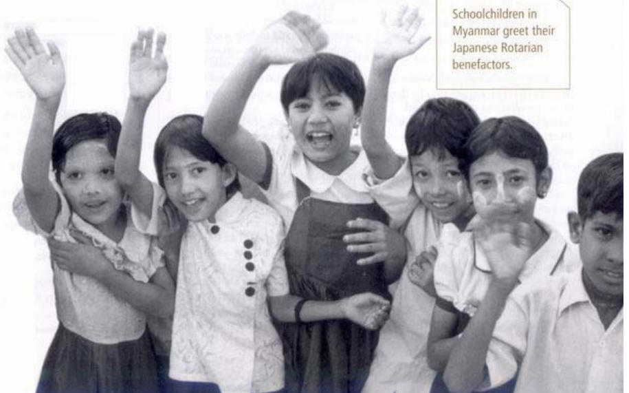
Schoolchildren in Myanmar greet their Japanese Rotarian benefactors.

在扶輪社報告的許多創意服務計劃中，尚比亞的朵拉-目庫巴(Ndola Mukuba)扶輪社為出獄的受刑人開辦一項小額貸款計劃，埃及的亞力山卓-馬里奧(Alexandria-Mariort)扶輪社評估25間工廠的安全措施，並為每間工廠的工人舉辦後續的安全講習課程。