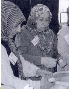
集中語言接觸計劃是2003-04年度識字與教育特別工作小組的行動之一。照片中是一些不識字的土耳其女性正在學習如何閱讀食譜，烹煮一道不熟悉的菜餚——這一次是做水果沙拉

欲深入了解2003-04年度的特別工作小組，請洽「公式名錄」的國際扶輪地帶協調人。