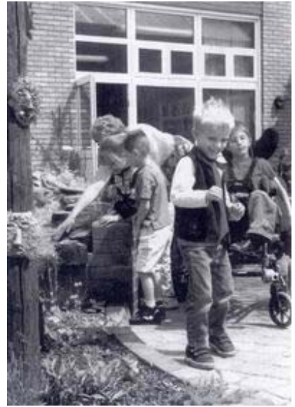
學生們在庭院的庭園裡發現多令人奮的特色。

該計劃也豐富了扶輪社員們的經驗。查普曼說：「看到孩子們生活裡的勇氣及喜悅，對他們而言殘障只是生活的另一項挑戰，讓我們覺得謙卑。」