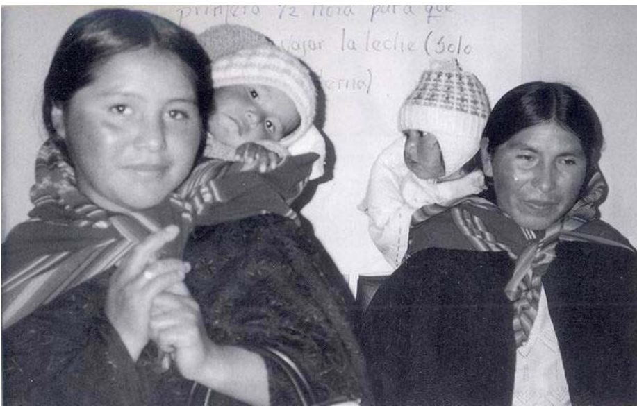
扶輪贊助的循環貸款基金協助改善參與者與其家人的生命，例如這些玻利維亞女性和其子女